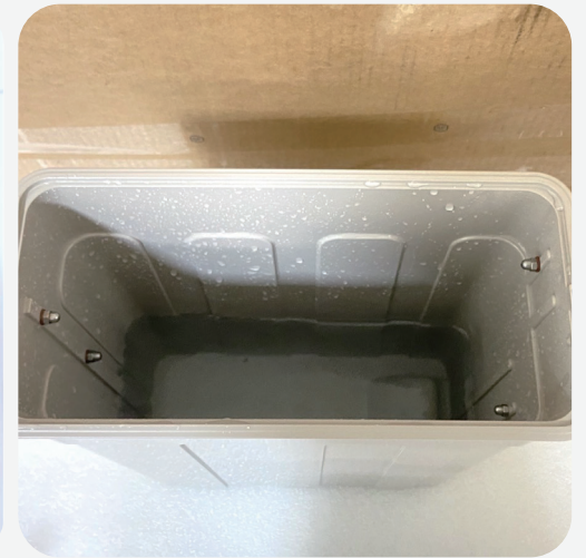
確認污水桶中， 污水低於一半以下