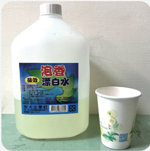
準備100cc消毒水 (含氯消毒水)