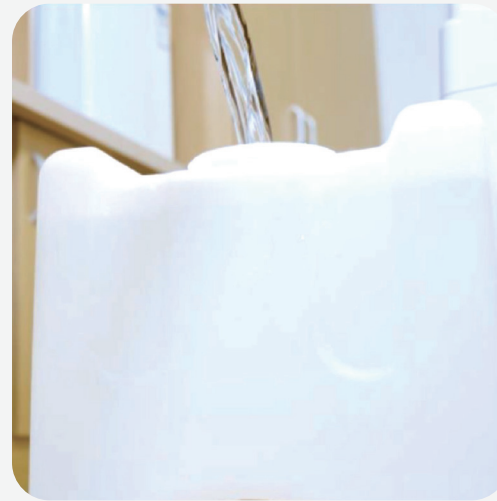
確認淨水桶中， 水位達到一半以上