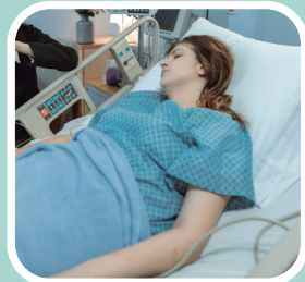
長期臥床 癱瘓患者