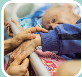
年邁長者 下床不易