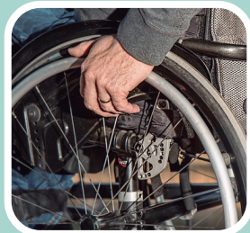
手術過後 行動不便